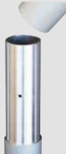
Steckstoß Z75, Z90, 2-teilig

5 Jahre Garantie auf Standicherheit der Mastrohre