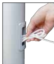
Nach dem Hiszen Seil in Schlaufen legen und als Bund in das Bediengehäuse stecken.