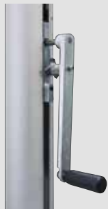
Kurbelhissvorrichtung alfa FlagLift® , Handkurbel