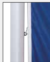
Mittleren Karabiner in die Ösen der Fahnentuchhalter einhaken.