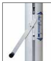
Kompaktantrieb, Handkurbel mit Entsperrstift