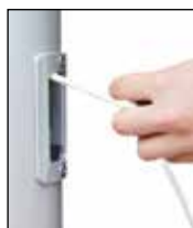
Hiszen der Fahne durch horizontales Ziehen, Einholen durch Loslassen.

Die klassische Innenseilführung mit dem im Mastrohr laufenden PES-Hisseil. Die Handhabung des Hisseiles erfolgt über das Bediengehäuse mit ( SchnellFixierSystem ) alfa-SFS mit sperrbarem Türchen. Hiszen und Abnehmen der Fahnen erfolgt durch Ziehen bzw. Nachlassen des Hisseiles. Bei Loslassen arretiert das Hisseil selbsttätig in der Spezial-Seilklemme im SFS-Gehäuse.