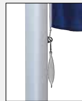
Untersten Karabiner – zusammen mit Fahnenstraffergewicht in Öse des untersten Fahnentuchhalters einhaken.